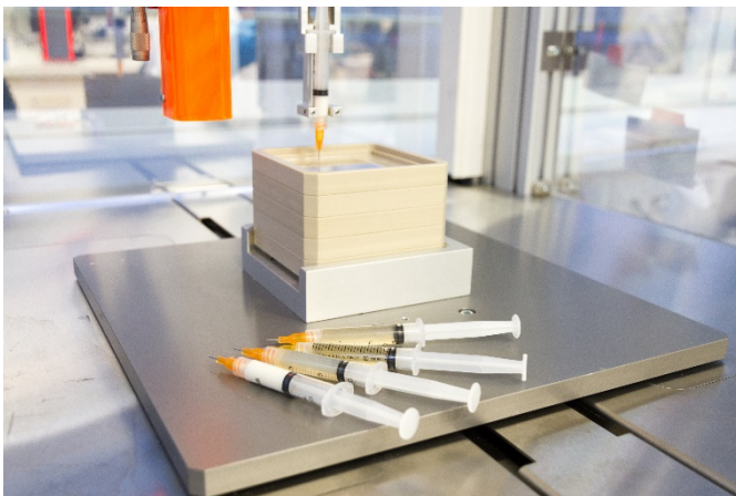
Abb. 2 Spritzen mit verschiedenen Biotinte-Formulierungen.